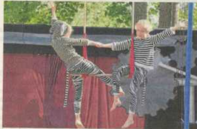
Die ganze Woche über haben die Schüler geprobt – zum Beispiel für solch eine Trapeznummer.

Der Rudolstädter stand mitten auf der Bühne, die Augen der Zuschauer waren auf ihn gerichtet.