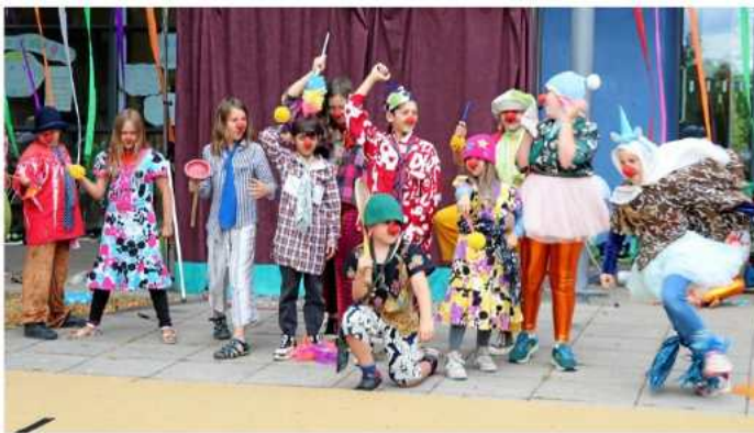
Eindrücke vom Freitag